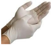
Găng tay – 2 đôi