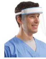
Tấm chắn bảo vệ