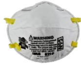
Khẩu trang N95