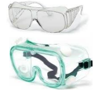
Kính bảo hộ